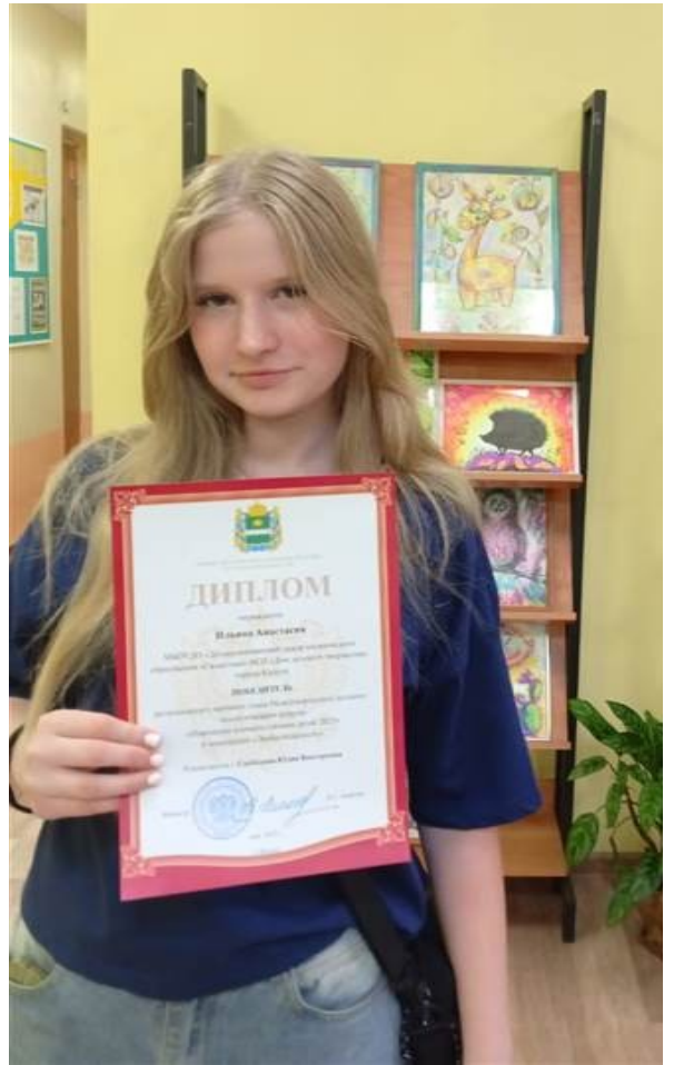
Готовимся в Артек!